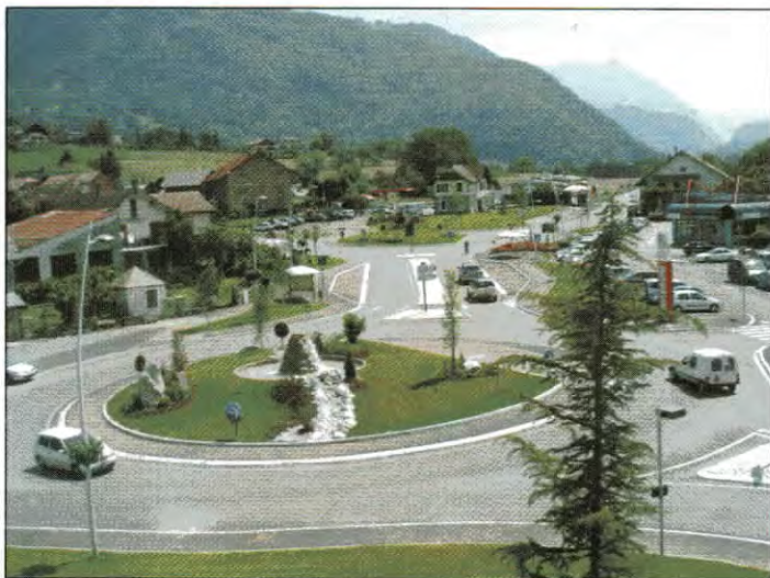
Vue du carrefour côté Peillonnex

Un chantier eau et assainissement est actuellement en cours au hameau de la Tremplaz, il s'agit d'une tranche de réfection complète des conduites d'eau, adduction et distribution ainsi que la pose d'un poteau incendie. Ces travaux font partie du schéma directeur de restauration totale du réseau d'eau potable de la commune. Parallèlement le secteur est équipé de colonnes d'égouts qui permettront aux habitants de la Tremplaz de se raccorder au réseau d'assainissement collectif. Le chantier terminé, la route sera goudronnée.