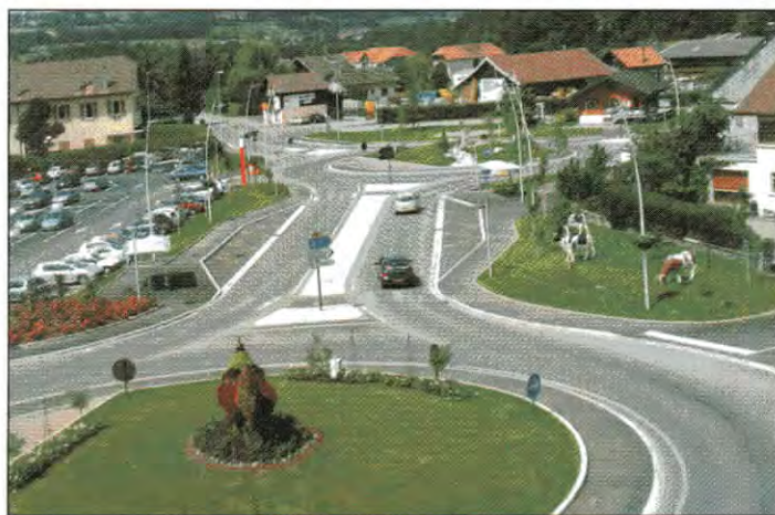
Vue du carrefour côté Viuz

Conjointement, une étude est en cours dans le but de remplacer le chalet actuel de l'office de tourisme par des arcades commerciales qui permettront de renforcer la diversité des commerces de Viuz-en-Sallaz.